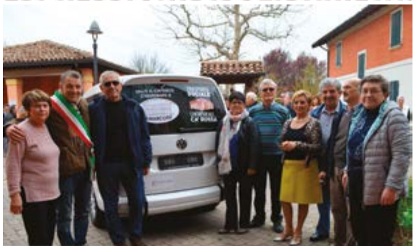
I volontari della Ca' Rossa insieme al Sindaco Veronesi all'inaugurazione del nuovo mezzo

È già attivo il nuovo Caddy Volkswagen per il trasporto sociale del Comune, acquistato grazie alla partecipazione di tanti e alle molte espressioni di solidarietà.