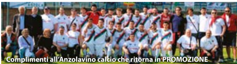
Complimenti all'Anzolavino calcio che ritorna in PROMOZIONE