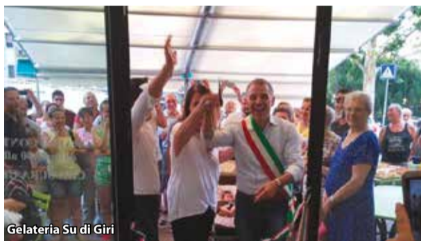
Gelateria Su di Giri