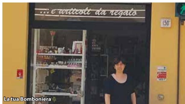
La tua Bomboniera