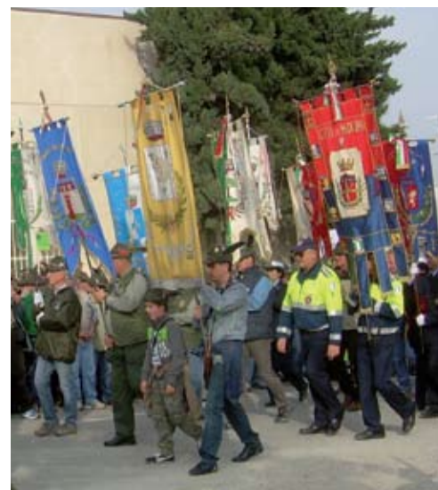
o Alpini con gonfalone