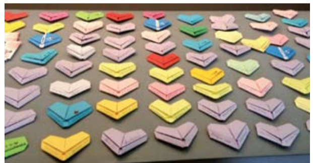
◉ Origami simbolo di senza atomica

Dall'11 ottobre al 3 novembre, Palazzo d'Accursio a Bologna, ha ospitato la mostra Senzatomica: un percorso di pace attraverso immagini e testimonianze video di alcuni sopravvissuti alle esplosioni di Hiroshima e Nagasaki, composto di 42 pannelli principali e 12 dedicati ai bambini. Il leitmotiv della mostra, organizzata dall'Istituto Buddista Soka Gakkai, era "trasformare lo spirito umano per un mondo libero da armi nucleari", con lo scopo di sensibilizzare i visitatori sulle conseguenze e sulle implicazioni politico-sociali derivanti dalla produzione, dal possesso e dall'uso di arma-