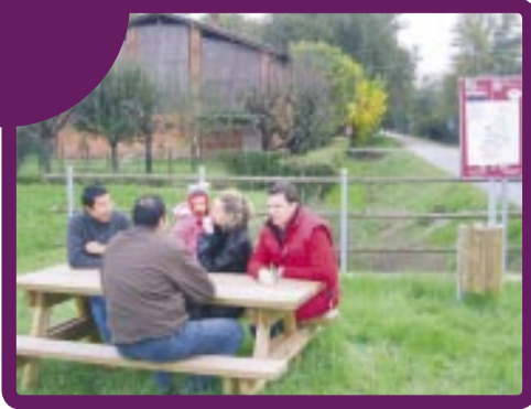
● Sosta lungo i percorsi ecologici.

● Vediamo quante cose si possono ottenere, risparmiando, dalla plastica riciclata: abiti e tessuti in pile, manufatti per arredi urbani, superficie opaca pavimenti per palestre, ecc