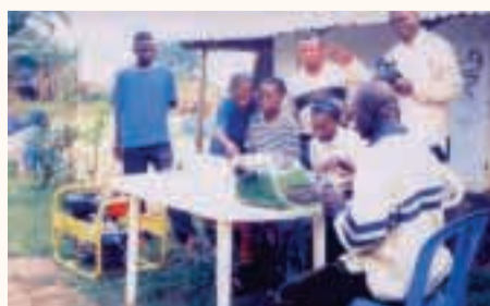
Corso di scrittura con le nostre macchine da scrivere