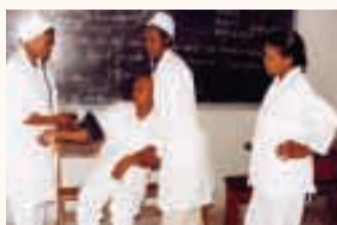
Terzo e ultimo anno di corso alla scuola ospedale di Kinsasha. Un aiuto per concludere serenamente i loro studi.