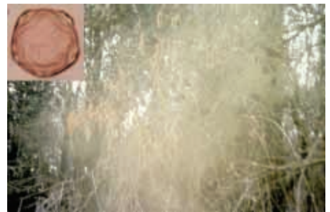
Pioggia di polline di Ontano al microscopio