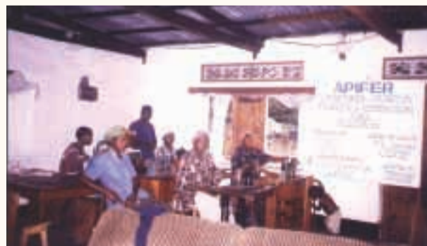
Corso di taglio e cucito delle donne di Madadi Babusongo.