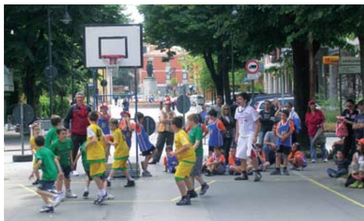
o Giugno minibasket