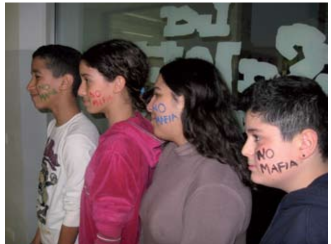
● Ragazzia al Centro Giovani di Anzola

Ore 20,00 Contest delle Band giovanili di Terre d'Acqua , evento che segna il culmine di una giornata all'insegna dell'impegno civile.