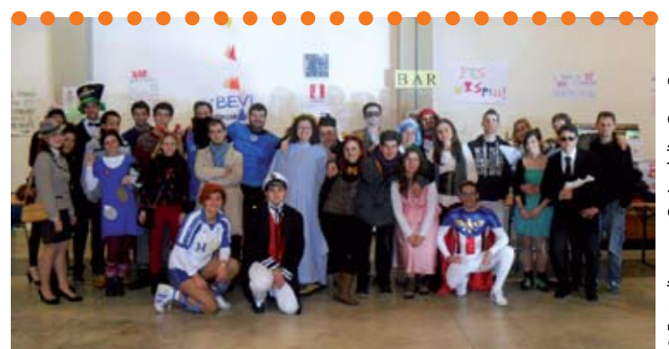
• Foto di gruppo Coriandoli e Gem Boy