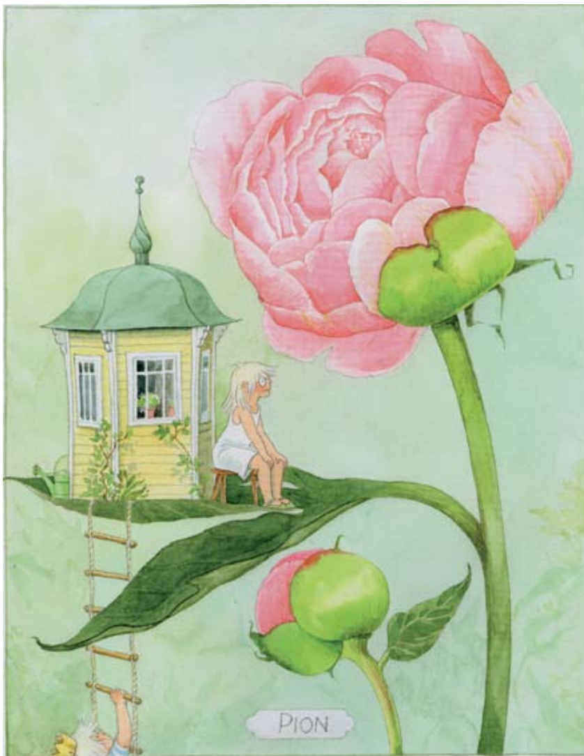
o Bambina con fiore Anderson

L'evento è sostenuto da G.D. SpA. Cosponsor Veronesi Studio Legale e Simone Garuti srl.