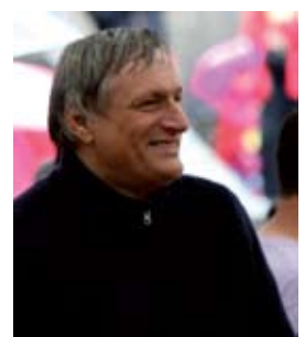
● Don Ciotti