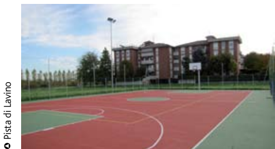
o Pista di Lavino

Facciamo il punto sulle politiche sportive e sulle nuove esigenze in campo.