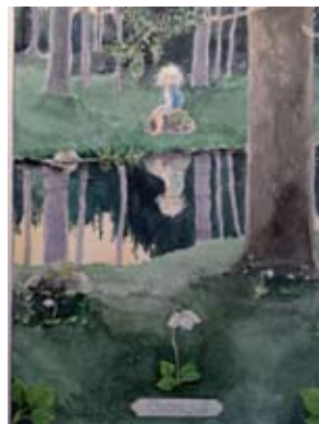
o Bambina sul lago Anderson