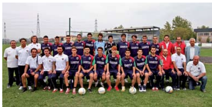
o Promozione anzolavino 2013