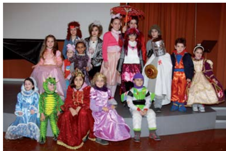
Foto di gruppo dei bambini

Meno blasonato di altri carnevali ma molto vissuto dai bambini e dalle famiglie, si è concluso il carnevale di Anzola dell'Emilia, con l'elezione della "più bella mascherina", concorso a premi che Comune e Pro Loco promuovono durante le giornate carnevalesche.