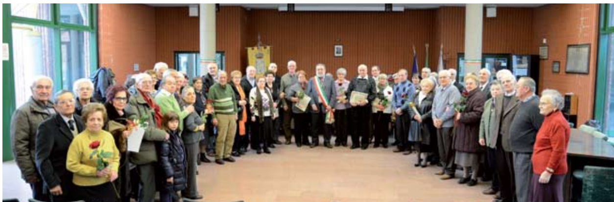
◉ Sposi 2012