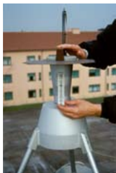
o Strumento che cattura i pollini

● Laboratorio di Palinologia Sustenia srl