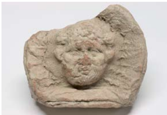
● Testina bassorilevo