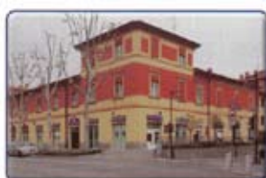
Coop Casa del Popolo Anzola dell'Emilia