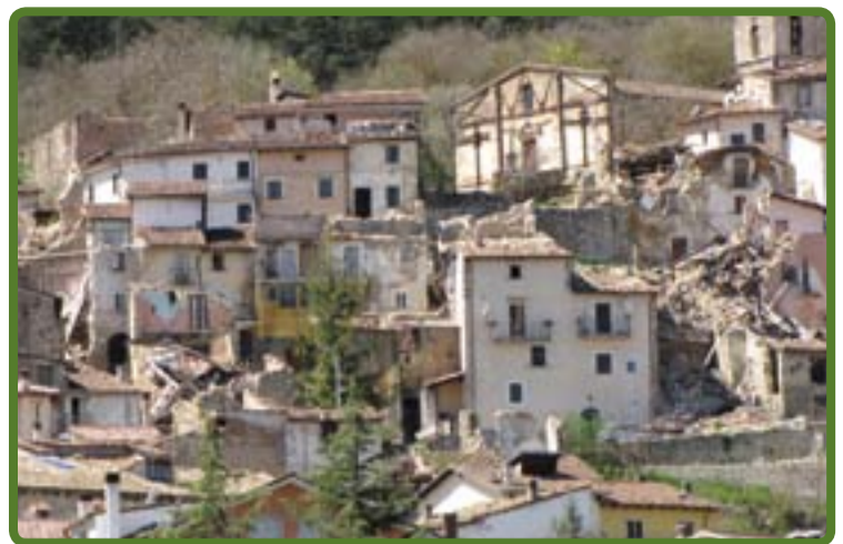
Panoramica di Villa S. Angelo

Il CDA della Sezione Soci di Anzola dell'Emilia