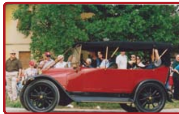
o Cavalli a confronto