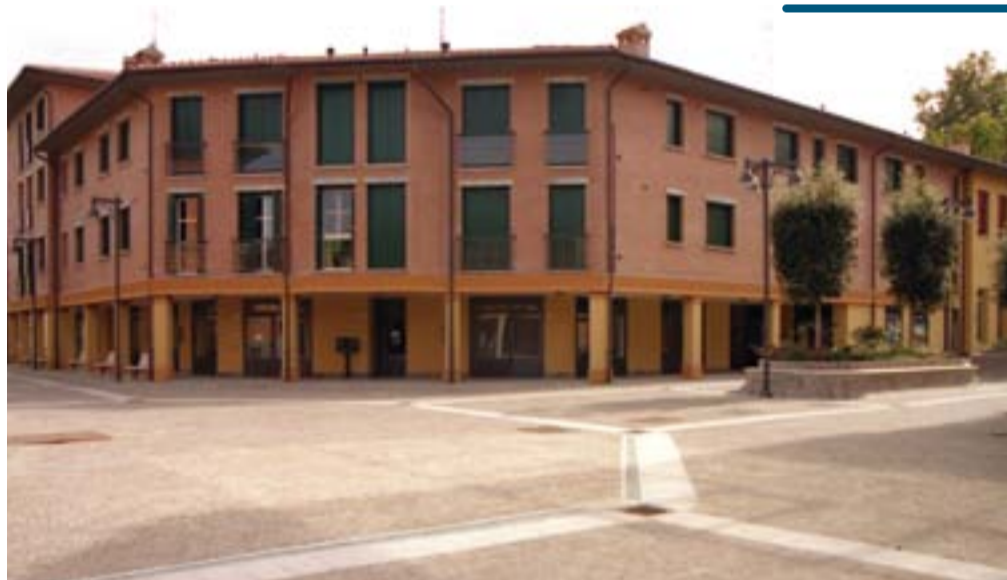
o Piazza Grimandi

Da segnalare anche l'ampliamento della possibilità di sistemazione dei parcheggi che passeranno dall'attuale dotazione di 450 mq a 1000 mq e la decisione di non ampliare ulteriormente l'edificabilità nell'ambito di una zona che viene considerata pregiata dal punto di vista della qualità storica ed urbana.