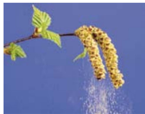
o Pollini di nocciolo