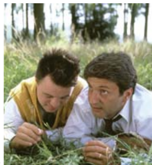
o Una scene dal film "L'ottavo giorno"