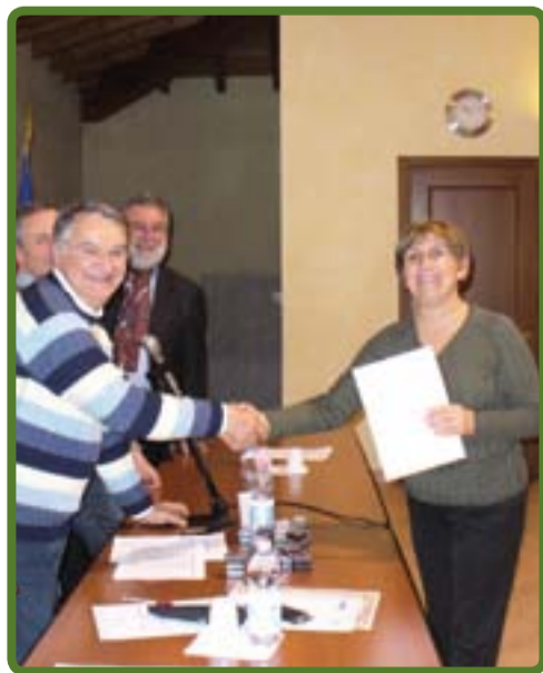
Consegna delle benemerienze

Info Avis Provinciale 051 388688 www.avis.it/bologna e-mail: bologna.provinciale@avis.it