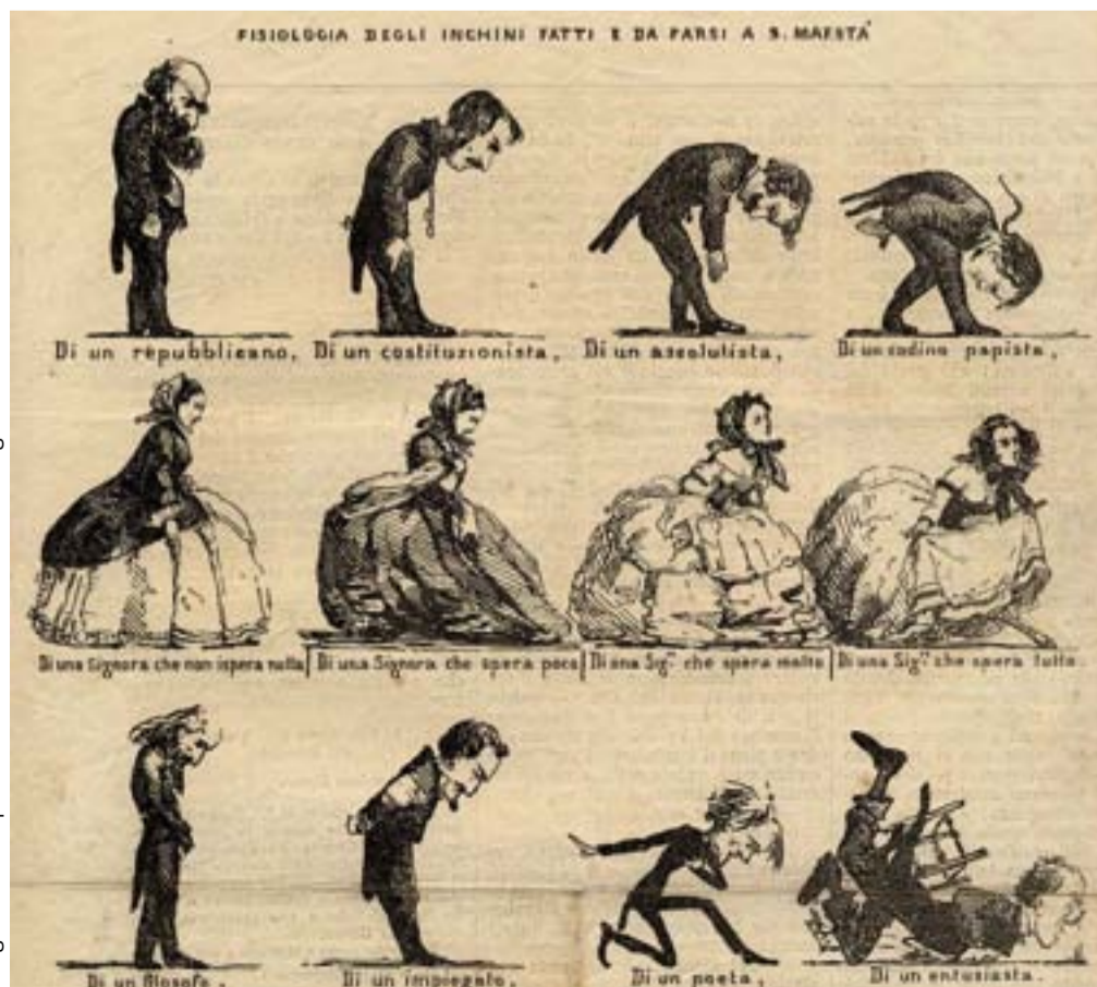
o Vignetta satirica per la visita di Vittorio Emanuele II a Bologna