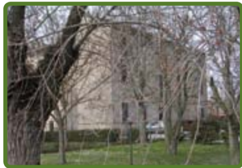
Palazzo Quattro Torri a Castagnolo