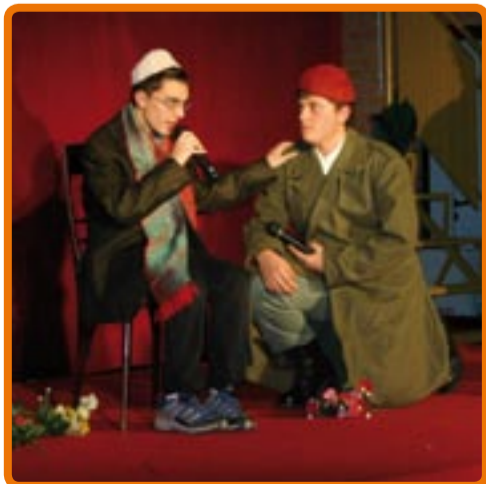
Spettacolo del 2008