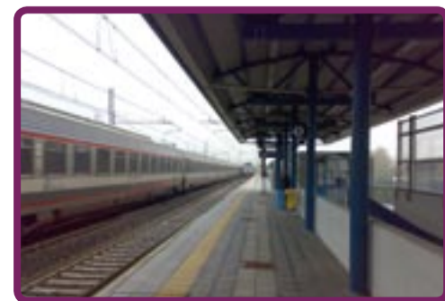
La stazione di Anzola