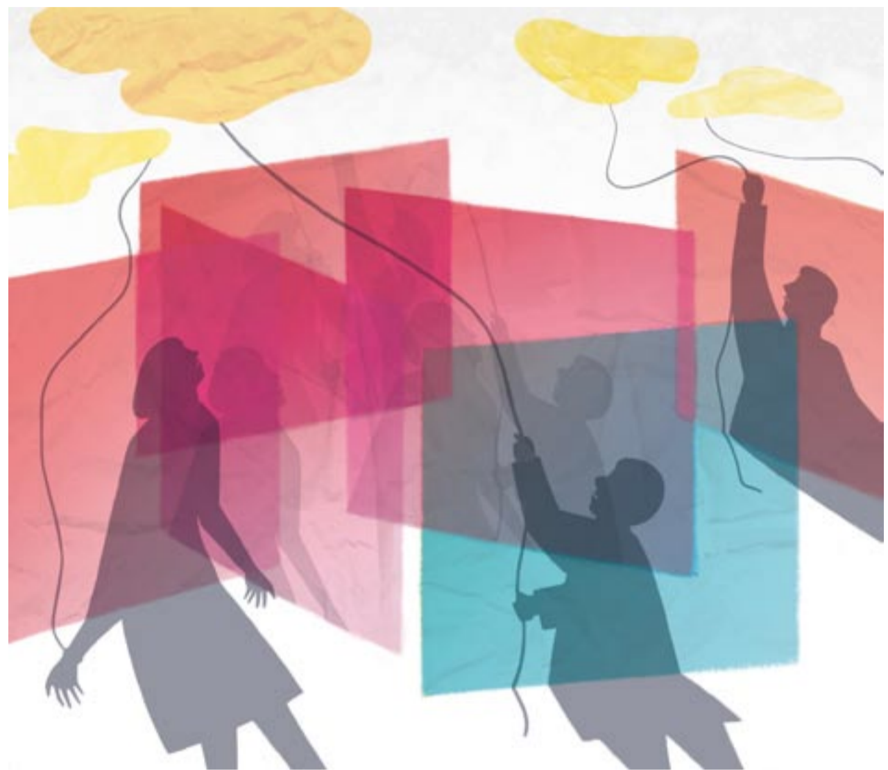
Illustrazione Umberto Mischi