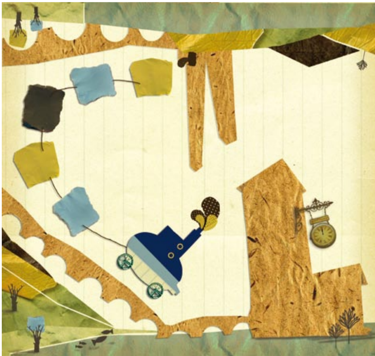
Illustrazione Martina Galetti