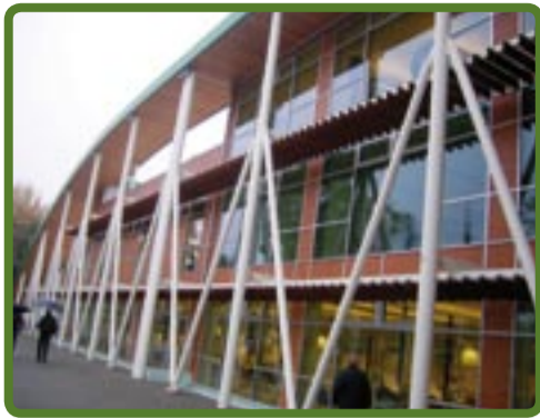
● La nuova casa del donatore