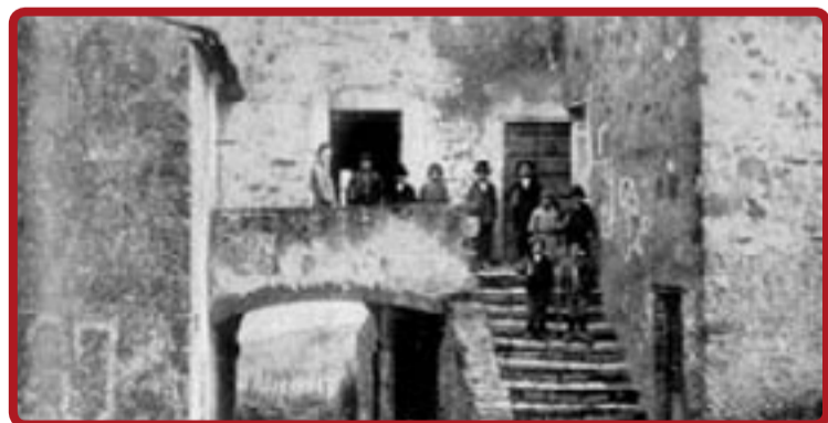
• Una scuola ed una scolaresca e l'entrata di una scuola nella seconda metà dell'Ottocento.