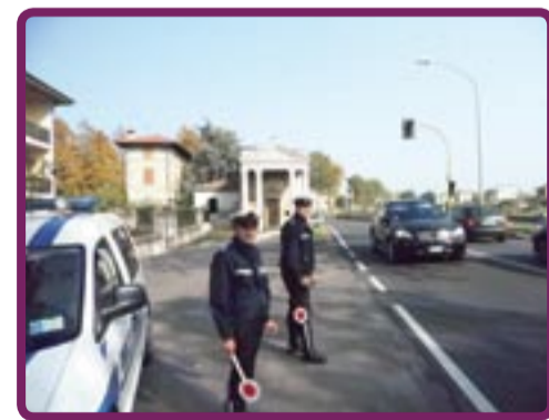
Pattuglia in servizio

Simili controlli sono oggi espletati mediante l'uso di apparecchiature quali il telelaser, che consentono quasi sempre la contestazione immediata al trasgressore, dando una grande visibilità alle pattuglie di Polizia Municipale e contribuiscono di conseguenza ad integrare la percezione di sicurezza da parte della cittadinanza.