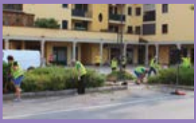
Volontari al lavoro a Lavino

La Consulta Territoriale di Lavino di Mezzo è composta da 5 membri eletti nel 2014. Siamo persone con percorsi, idee ed età diverse, unite nel rappresentare il territorio e gli abitanti di Lavino. Il nostro compito è di collaborare con l'Amministrazione con funzioni conoscitive, di iniziativa, consultive e propositive, in base al Regolamento delle Consulte. Finora ci siamo occupati dei temi legati alla raccolta differenziata, all'ambiente, al taglio degli alberi, al commercio, ad attività ricreative e culturali. Promuoviamo indagini su problematiche locali e ci impegniamo a presentare le nostre proposte alla Giunta Comunale. Attraverso il progetto di cittadinanza attiva "ILAVYOU" ci dedichiamo assieme a cittadini volenterosi alla cura del verde del nostro territorio. Proponiamo interventi in sinergia con il limitrofo Quartiere Borgo Panigale. Ci incontriamo al Centro Civico di via Ragazzi 6, speriamo di vederci alle prossime iniziative.