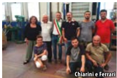
Chiarini e Ferrari

operatori e la loro costante ricerca di soddisfare le esigenze dei clienti, oltre ad una particolare attenzione al territorio che spesso si manifesta nel supportare iniziative a carattere sociale per la nostra comunità.