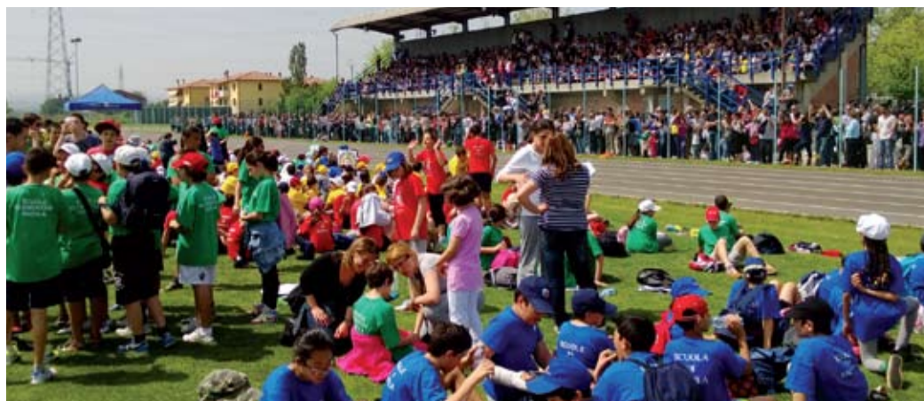
Giochi a scuola 4.5.2013