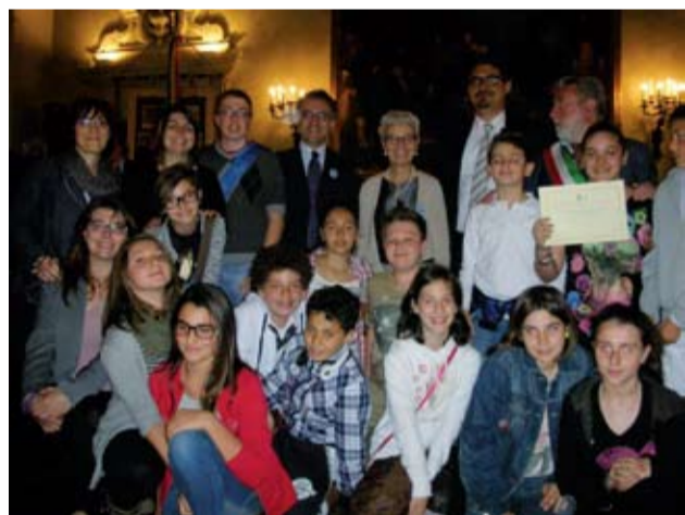
● Premio cittadinanza attiva

cercato di rispondere a tanti interrogativi: come vengono decise le regole? Come posso contribuire? Come si fa a rispettarle? C'è qualcuno che ci aiuta a rispettarle? Come posso a mia volta fare in modo che chi mi circonda rispetti insieme a me le regole? Il premio è senz'altro un riconoscimento al progetto ed al lavoro svolto tutti insieme, fermo restando che il vero "premio" sarà il ricordo che ognuno conserverà dell'esperienza.