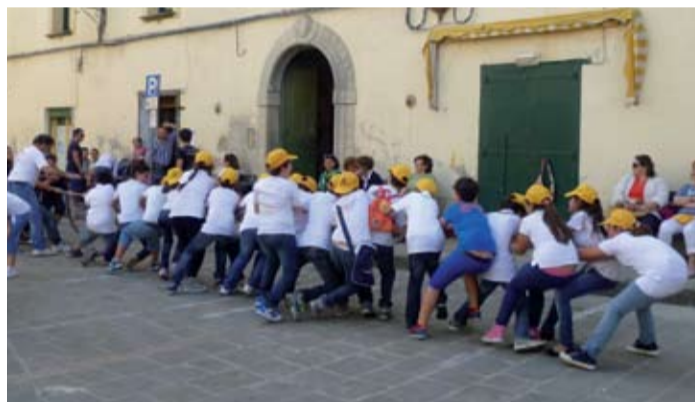
● Giochi insieme