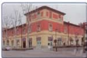
Coop Casa del Popolo Anzola dell'Emilia