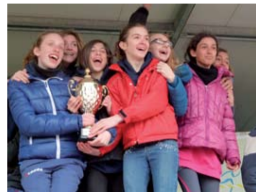
31.3.2013 Policiano