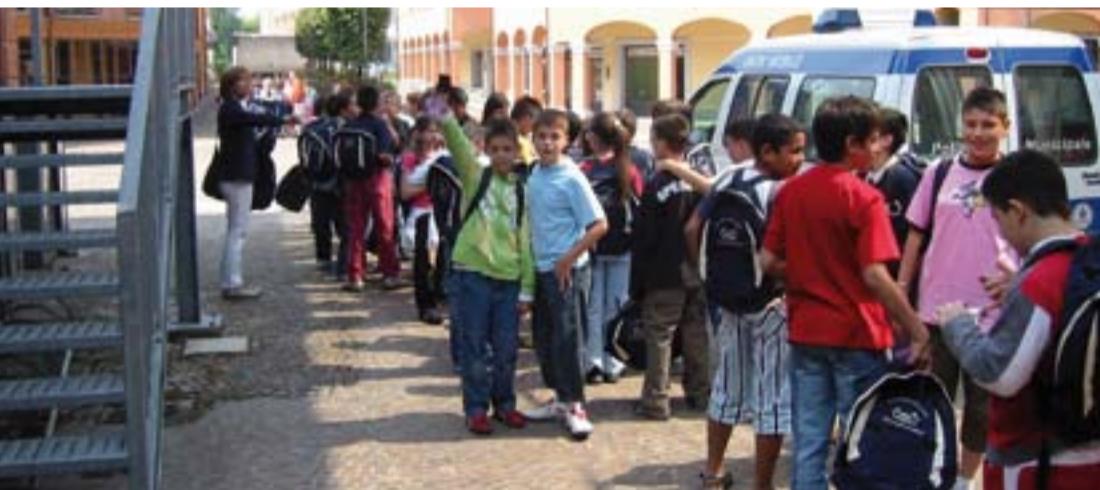
● Educazione stradale 2008

Il percorso di educazione stradale poi prosegue nelle scuole secondarie nell'ambito di un progetto che fino allo scorso anno era sperimentale e ci vedeva coinvolti in altre realtà del territorio dell'Associazione Terred'Acqua.