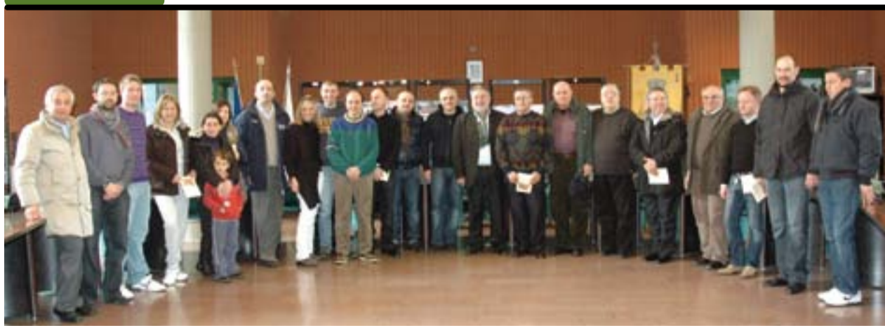
10 gennaio in Municipio con Anzola Basket