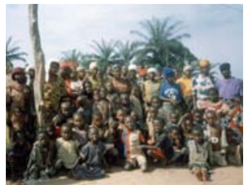
I ragazzi aiutati da Anzola Solidale