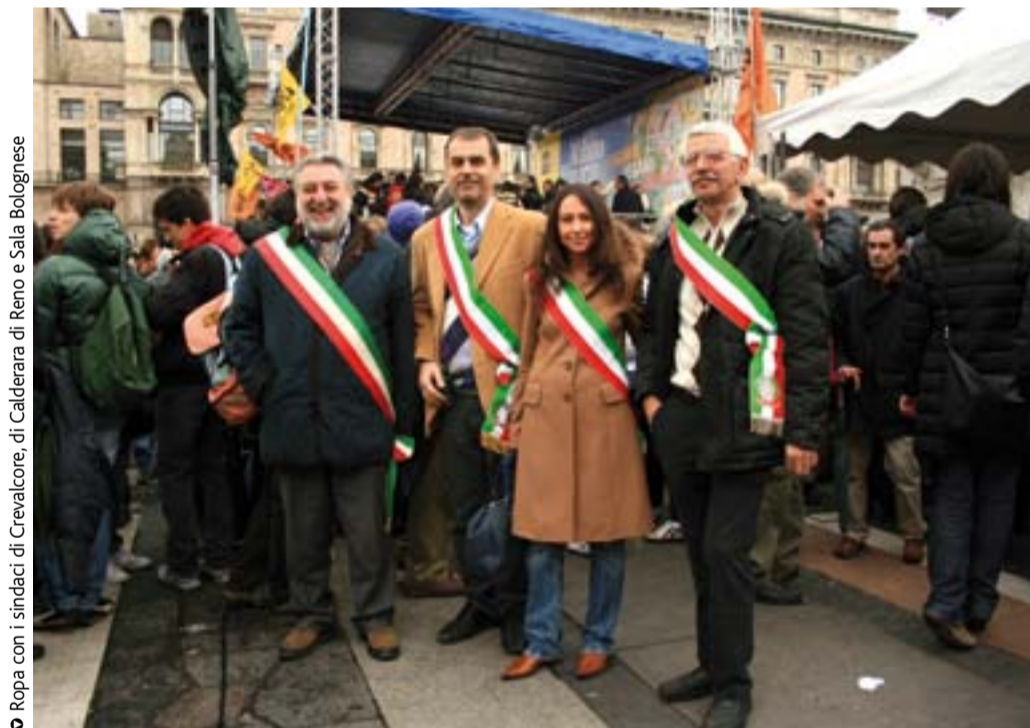
o Ropa con i sindaci di Crevalcore, di Calderara di Reno e Sala Bolognese