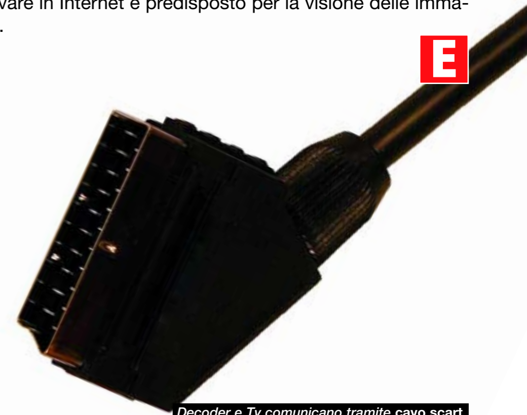
Decoder e Tv comunicano tramite cavo scart